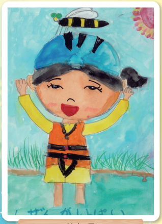
佐賀県 鳥栖小学校 2年