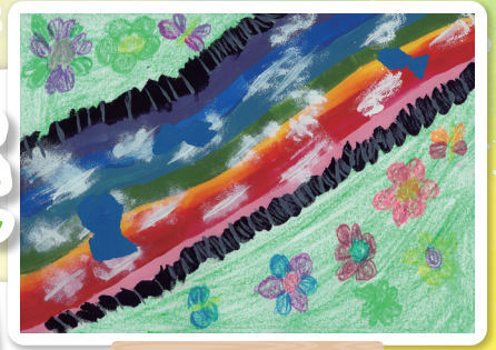
福岡県 弓削田小学校 2年