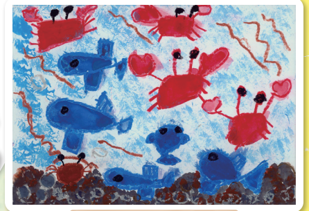
宮崎県 幼保連携型認定こども園ゆりかごWEC学院 年長