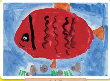
熊本県 福島保育園 5歳