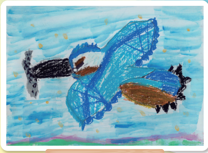
鹿児島県 年長 6歳