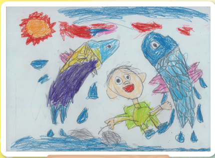
長崎県 彼杵小学校 1年