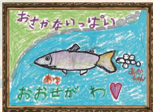
宮崎県 東海幼稚園 年少