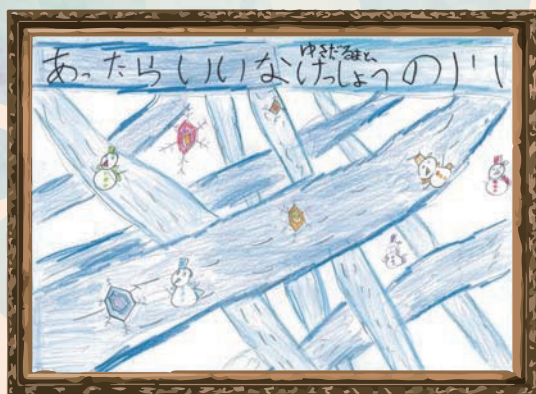
福岡県 田川小学校 1年