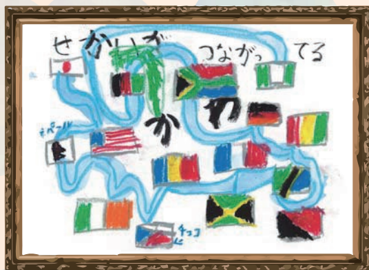
熊本県 福島保育園 年長