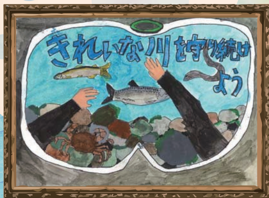
大分県 渡町台小学校 4年