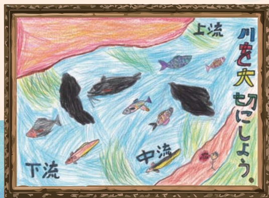
佐賀県 嘉瀬小学校 4年