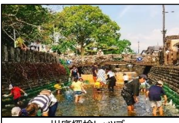
川底探検レッツゴー