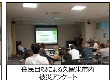
住民目線による久留米市内 被災アンケート