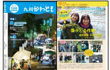
住民目線による流域情報の発信