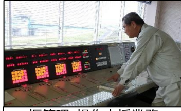
堰管理・操作支援業務