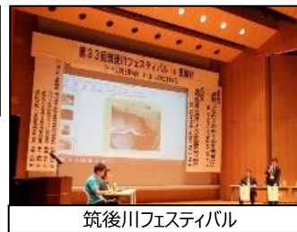
筑後川フェスティバル