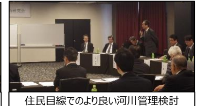
住民目線でのより良い河川管理検討 九州河川維持管理技術研究会