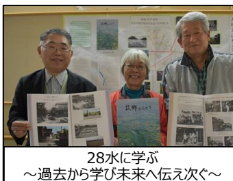
28水に学ぶ ～過去から学び未来へ伝え次ぐ～