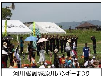
河川愛護城原川ハンギーマつり