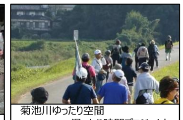
菊池川ゆったり空間 湯ったり時間プロジェクト