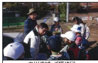
白川流域ツズ探偵団