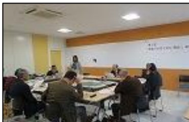
筑後川の起源（成り立ち）研究