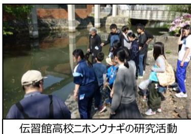
伝習館高校二ホンウナギの研究活動