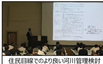
住民目線でのより良い河川管理検討 九州河川技術に関する講習会