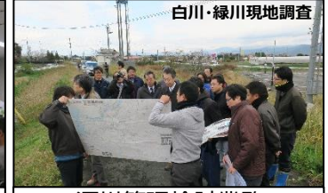
白川・緑川現地調査