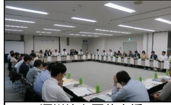
河川協力団体支援