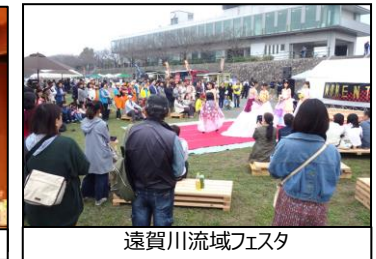
遠賀川流域フェスタ