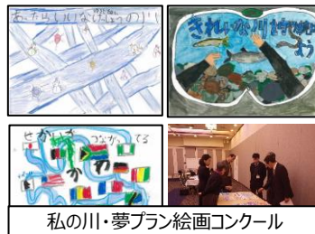
私の川・夢プラン絵画コンクール