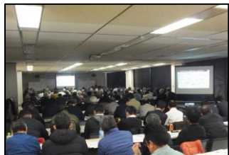
河川維持管理技術講習会