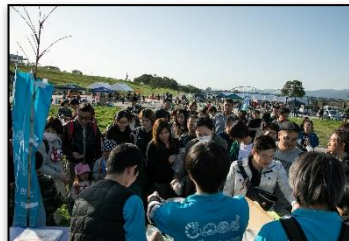
河川市民活動人材育成システム検討