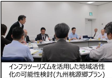
インフラツーリズムを活用した地域活性化の可能性検討（九州桃源郷プラン）