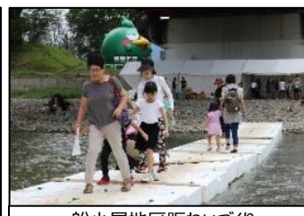
船小屋地区賑わいづくり