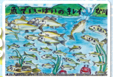
大分県 都留小学校 6年