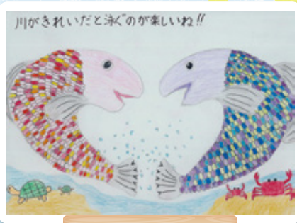
福岡県 千代小学校 4年