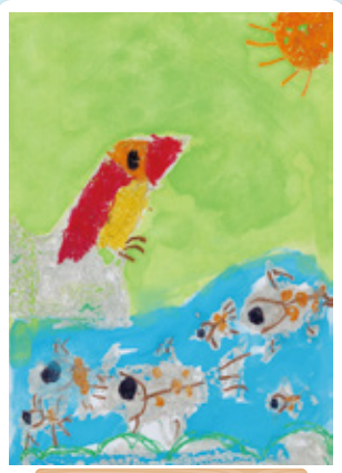
鹿児島県 志布志保育園 年長