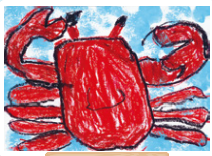
宮崎県 幼保連携型認定こども園 ゆりかこ WEC 学院 年長