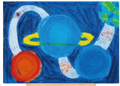
佐賀県 旭小学校 2年