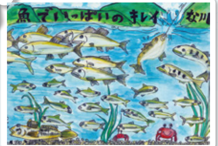
大分県 都留小学校 6年