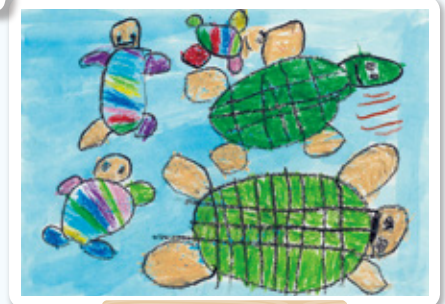
熊本県 福島保育園 年長