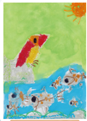
鹿児島県 志布志保育園 年長