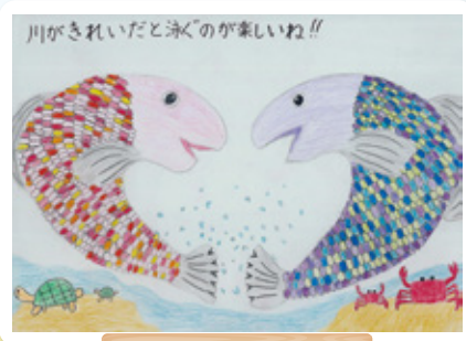
福岡県 千代小学校 4年