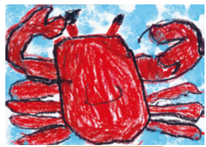
宮崎県 幼保連携型認定こども園 ゆりかご WEC 学院 年長